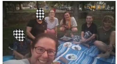
Picknick mit der WG und meiner Deutschschülerin