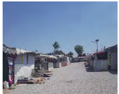
Ausflug ins Malacasa Camp