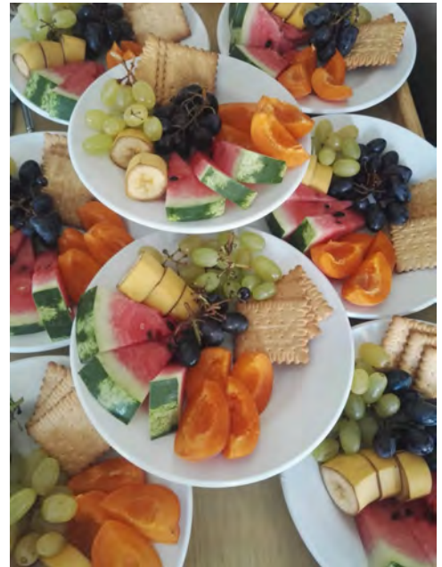
Obst und Kekse für den Deutschkurs

Mit der einen habe ich mich anschließend noch öfters getroffen um mit ihr zusammen Bibel zu lesen oder zusammen zu reden und zu essen. Dabei hat sich herausgestellt, dass sie sich vor wenigen Monaten entschieden hat, Jesus nachzufolgen. Bitte betet für sie, dass sie im Glauben wächst und Gott ihre Geschichte gebraucht, um andere zu ihm zu führen.