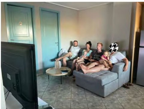
Fußball gucken auf dem Retreat